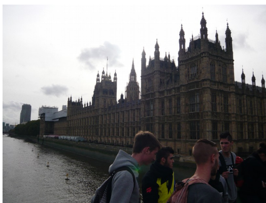
The apprentices in front of the Palace of Westminster

La semaine a été appréciée par tous et une exposition en rendra compte lors des prochaines Portes ouvertes de l'établissement le samedi 28 février 2015.